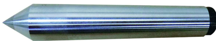
標準センター(超硬付)