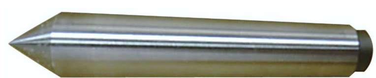
標準センター(焼入れ品)

「正しくお使いいただくために、必ずご使用前には、この取扱説明書をよくご覧の上ご使用ください。 またお読みになった後は、お使いになる方がいつでも見られる所に大切に保管して下さい。」